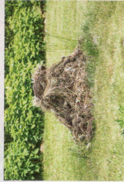
Kompostiranje na hrpi